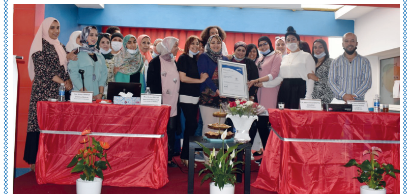
Le groupe devient la première école primaire au Maroc et en Afrique à détenir ce certificat, et ce depuis le 20 avril 2021.

Encore une entreprise marocaine qui a su transformer la crise en opportunité même si, pratiquement sans surprise, son chiffre d'affaires a baissé de plus de 50% en 2020. Il semble que le passage au «distantiel», à cause du confinement, n'a pas réellement bouleversé les modes d'apprentissage proposés par La Farandole. «Quand l'enseignement a été mis en rude épreuve pendant le confinement, et après, nous étions prêts à faire le distantiel sans problème, car les enseignants et les élèves étaient déjà familiarisés avec la technologie et l'outil informatique».